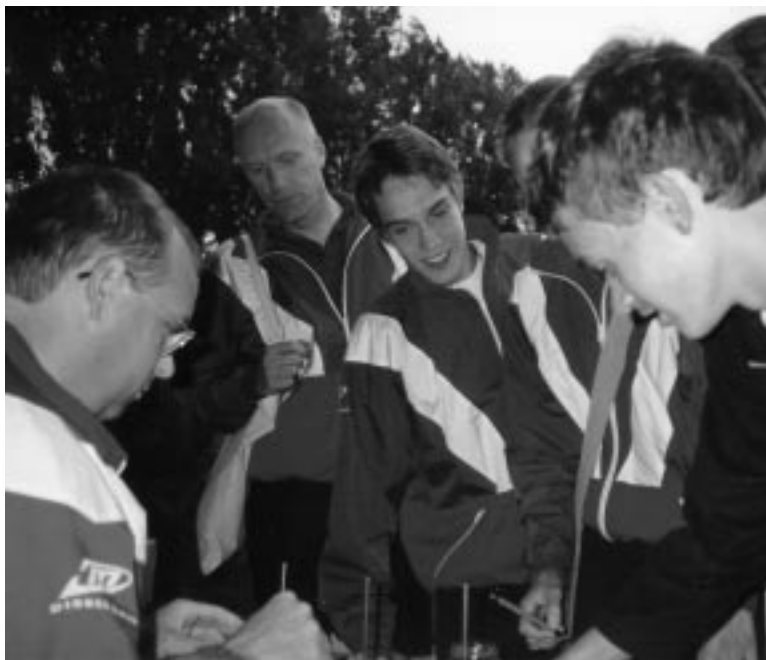
Inschrijving voor de Bosbaanloop.